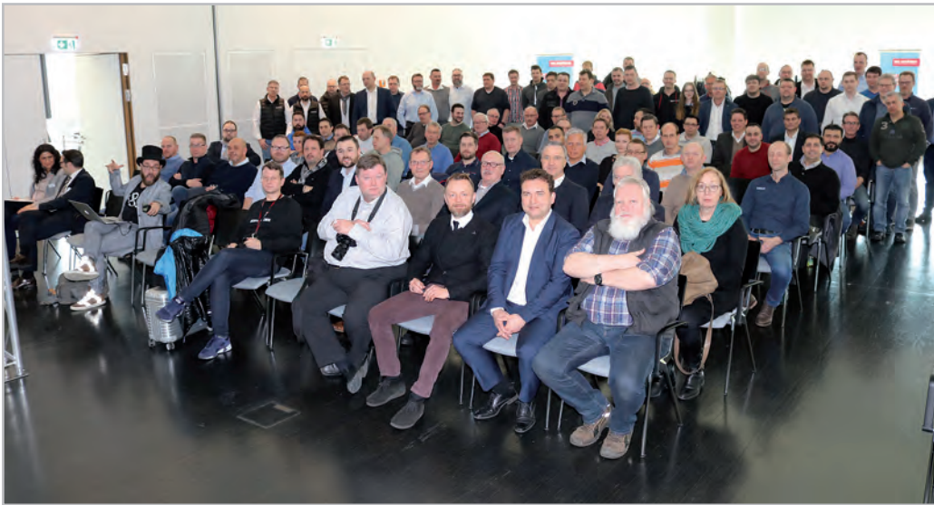
Oben: Die diesjährige Wittich COPARTS-Cheftagung fand im Campus Handwerk in Bielefeld statt

legen und Handelspartnern an. „Die Investition in Referenten und der Organisation für einen solchen Chef-Tag hat sich bewährt. Wir erreichen so unsere Kunden, die sich auch gerne für solch ein Event die Zeit nehmen“, so der Geschäftsführer in der dritten Generation. Das Familiengeführte Unternehmen ist Gesellschafter der COPARTS.